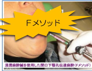
浸潤麻酔針を使用した閉口下顎孔伝達麻酔(Fメソッド)